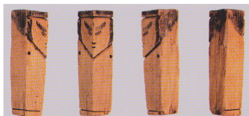
初めて発掘された七夕人形の4面図 （調査報告書より）

なお、城下町跡の発掘で出土した遺物の一部は武家地での出土品も含めて、松本市立博物館の1階に展示されています。実物をご覧になりたい方におすすめです。