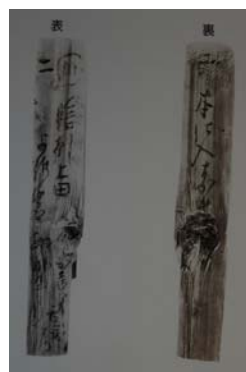
左：松本市立博物館の展示 右：木製の荷札（発掘調査報告書より）