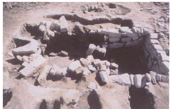
発掘された麴竈（調査報告書より）

東部地区コミュニティー防災広場がつくられる場所が発掘対象になりました。この場所は、1697（元禄10）年頃の史料に間口5間の麴屋 こうじや があったとされている場所でした。麴屋であったことを裏づけるように、麴を造るときにつかたとみられる麴竈 かまど の跡が見つかりました。直径が2m40cmの円形と2m60cm×2mの方形の部分が組み合わさっている石組の竈で、火が使われたあとが残っていました。その