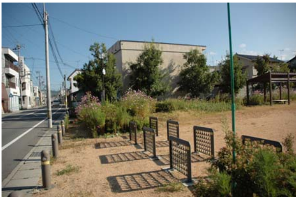
東町の発掘地点の現在（城東2丁目3番）