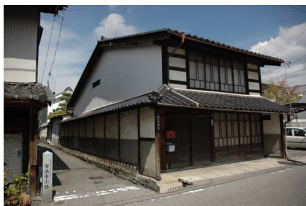
安原町にある招き造りの家

切妻の屋根を前後均等の長さにしないで道に面した表側を短くして奥の部分を長くした家の造りを「招き造り」といいます。そうすると道に面した側の屋根が前面から見えにくくなって間口側の正面部分を高く広くみせることができます。また、奥に長い敷地を生かした建物をたてることができます。