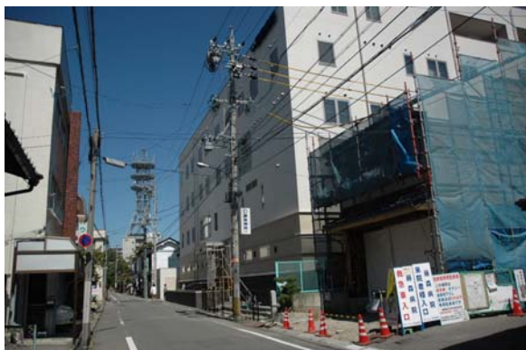
飯田町の発掘地点の現在（中央2丁目9番）

藤森病院の建替えにともなう発掘では、高さ8.5cm、幅2.9cmの角柱状の木に、人間の顔が描かれ、肩の位置にうでとなる木を差し込んだと思われる小穴があいたものが発見されました。これは七夕人形の胴体部と思われ、同時に出土した遺物から18世紀後半から19世紀初頭のものとして見られています。松本の町内から始めて発見された江戸時代後半の七夕人形ということになります。（「松本城下町跡 飯田町第1次発掘調査報告書」『松本市文化財調査報告 NO202』）