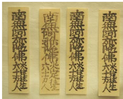
上人から人々にわたされた札

このように、遊行上人の廻国は非常に大掛かりな行事でした（以上の史料は松本市文書館所蔵河辺文書中「文政八乙酉年三月 遊行上人様御通行諸記録 河辺盛信」による）。