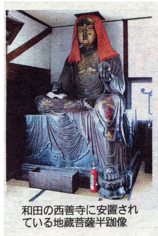
和田の西善寺に安置されている地蔵菩薩半跏像