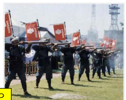
国宝松本城400年まつりで祝砲を放つ

会報松本城鉄砲蔵第9号によれば、「国宝松本城400年まつり開会式で祝砲を放つ松本城鉄砲隊」の見出しで報じている。開会式は平成5年7月16日夢御殿(二の丸内に設置)での祝砲であった。 大太鼓合図・大砲一発・鉄砲連射10発・斉射10発・大砲1発の順で、轟音城下に響き渡る。